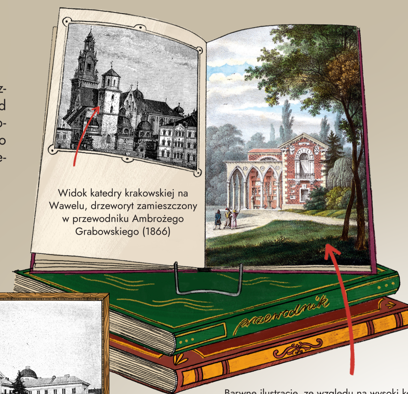
Widok katedry krakowskiej na Wawelu, drzeworyt zamieszczony w przewodniku Ambrożego Grabowskiego (1866)